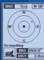
Pop-up-Fenster zur Positionsermittlung