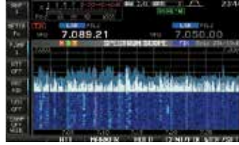
Spektrumskop mit Wasserfall (Widescreen)