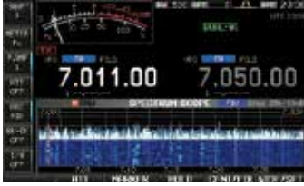
Spektrumskop mit Wasserfall

Mit der Wasserfall-Funktion lassen sich wechselnde Signalamplituden über einen längeren Zeitraum gut im Display beobachten. Selbst schwache Signale, die im Spektrum nicht sichtbar sind, werden im Wasserfall auffällig. Wenn man das Spektrumskop zusammen mit der Wasserfall-Anzeige nutzt, kann man schwache Stationen und die Bedingungen auf dem Band sehr gut erkennen.