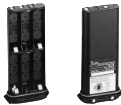
▲ BP-223 ▲ BP-224

BP-223 BATTERIEGEHÄUSE Gehäuse für R6 (AA)×6 Alkalinezellen BP-224 AKKU-PACK 7,2-V/750-mAh-NiCd-Akku-Pack. Es ermöglicht ca. 8 Stunden Betriebszeit. Senden (hoch):Empfangen:Standby=5:5:90