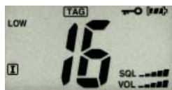
Das Foto zeigt die Originalanzeige.