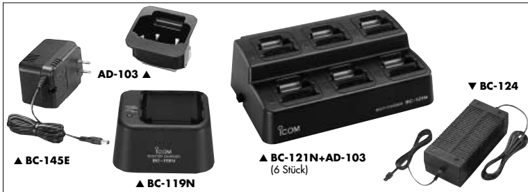
▲ AD-103 ▲ BC-145E ▲ BC-119N ▲ BC-121N+AD-103 (6 Stück) ▼ BC-124

BC-150 TISCHLADEGERÄT + BC-147E NETZTEIL Normalladegerät, Ladezeit für BP-224 ca. 8 Stunden.