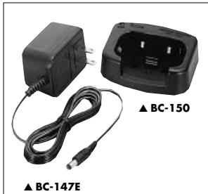
▲ BC-147E ▲ BC-150

BP-223 BATTERIEGEHÄUSE Gehäuse für R6 (AA)×6 Alkalinezellen BP-224 AKKU-PACK 7,2-V/750-mAh-NiCd-Akku-Pack. Es ermöglicht ca. 8 Stunden Betriebszeit. Senden (hoch):Empfangen:Standby=5:5:90