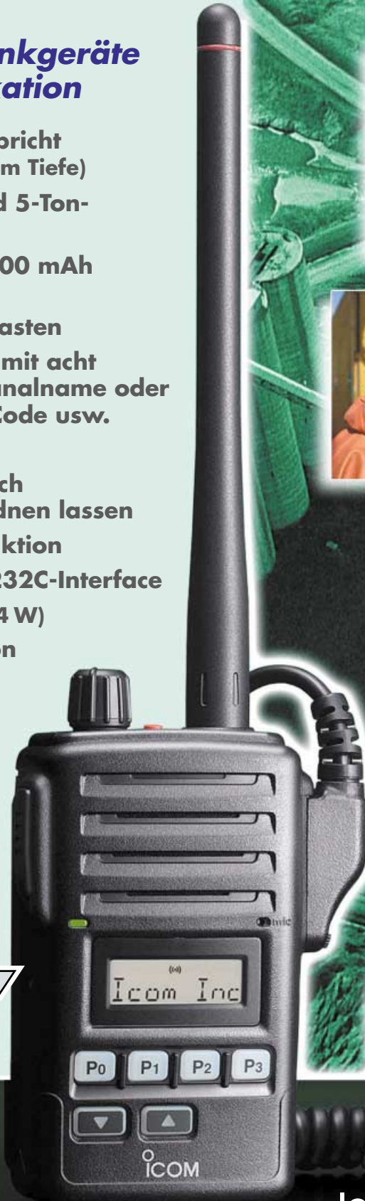
Foto mit optionalem Lautsprechermikrofon HM-138