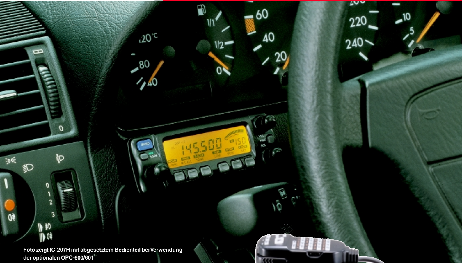
Foto zeigt IC-207H mit abgesetztem Bedienteil bei Verwendung der optionalen OPC-600/601